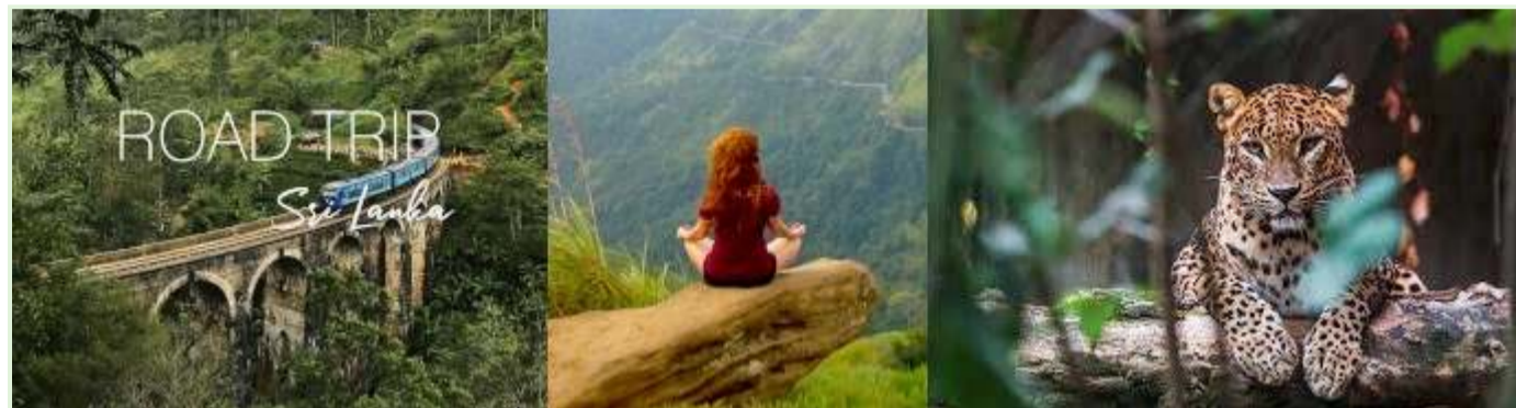
Почивки в Шри Ланка - обиколки сред природата с водач и експедиции

Време: Експериментът стартира по време на пандемията от COVID-19, когато икономиката на Шри Ланка, зависима от туризма, вече беше сериозно засегната.